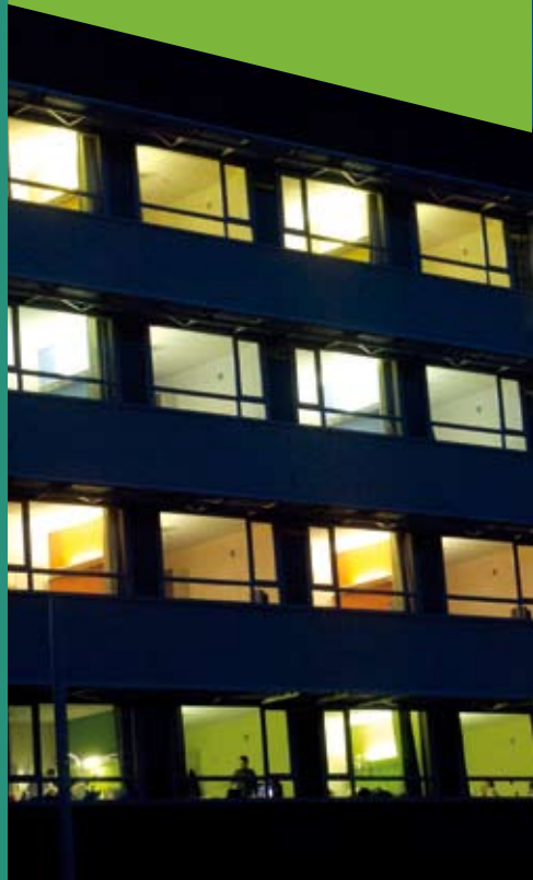
AZ Sint-Lucas – Groenebriel 1, 9000 Gent www.azstlucas.be