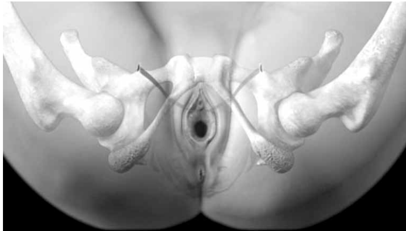
Anatomische positie van de sling

zachte ondergrond (gras) blijft er water doorkomen. Op een harde ondergrond (plank) lukt het wel en kan er geen drup meer door. Het bandje werkt zoals die plank. Bij drukverhoging (bijvoorbeeld hoesten) zal de plasbuis nu tegen het bandje dichtgedrukt worden, zodat er geen of weinig urineverlies optreedt.