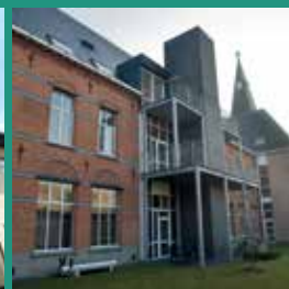
Aalter Lostraat 28 9880 Aalter