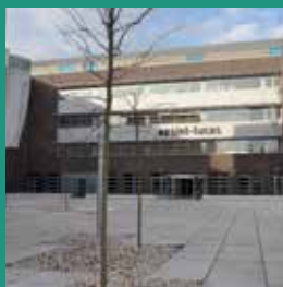
AZ Sint Lucas Groenebriel 1 9000 Gent