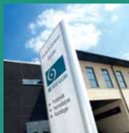
Zelzate Bloemenboslaan 26 9060 Zelzate