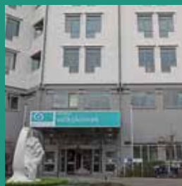
Campus Volkskliniek Tichelrei 1 9000 Gent