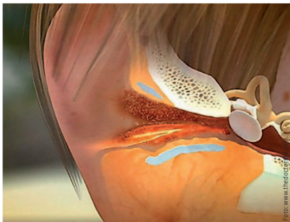
Ontsteking van de gehoorgang kan pijnlijk zijn.